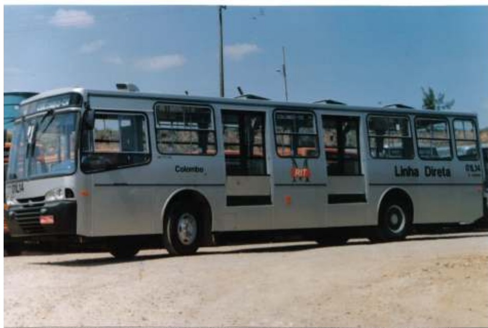
Ônibus Alpha ligeirinho Volvo B58 pref. 01L14 recém adquirido A.V. Santo Antonio.

Conforme programado pelo cronograma da URBS a primeira fase de implantação do ligeirinho para a região metropolitana de Curitiba foi cumprida com êxito. Cinco municípios passam a contar com pelo menos uma linha ligando-os à RIT - Rede Integrada de Transporte de Curitiba. O município de Almirante Tamandaré conta com uma linha direta ligando o terminal Cachoeira à Fazendinha com passagem pelo Guadalupe e uma troncal até o centro de Curitiba. São José dos Pinhais conta com a linha direta Barreirinha-São José (com passagem no Guadalupe) e a linha direta Aeroporto - Centro Cívico (ex PUC - passando pela Rodoferroviária). Araucária tem a linha direta Araucária-Curitiba (Praça Rui Barbosa). Colombo tem a linha direta Colombo - CIC e uma troncal do terminal Maracanã até o Guadalupe. Pinhais conta com a linha direta Pinhais - C. Comprido, a troncal Pinhais - Alto da XV e a expressa Pinhais-Rui Barbosa. Todos os municípios receberam também novas linhas alimentadoras. ■