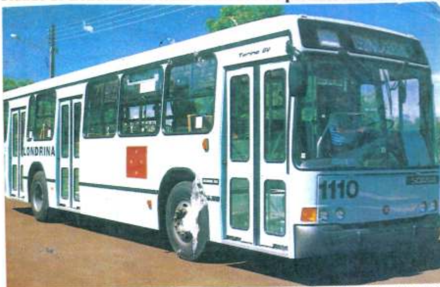
Marcopolo Torino GV 3P Scania L113