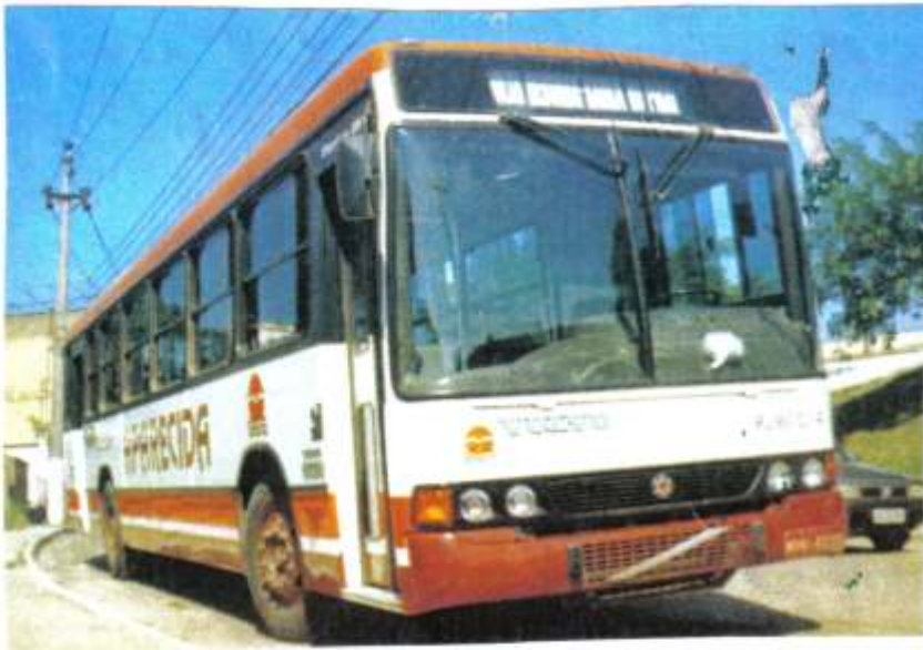
Marcopolo Torino GV 2P Volvo B58